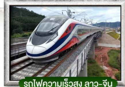
รถไฟความเร็วสูง ลาว-จีน