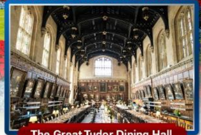
The Great Tudor Dining Hall

พิเศษ!! เมนูเบอร์เกอร์ต้อนรับ & กุ้งล็อบสเตอร์ และ เปิดย่างไฟร์ชิลล์