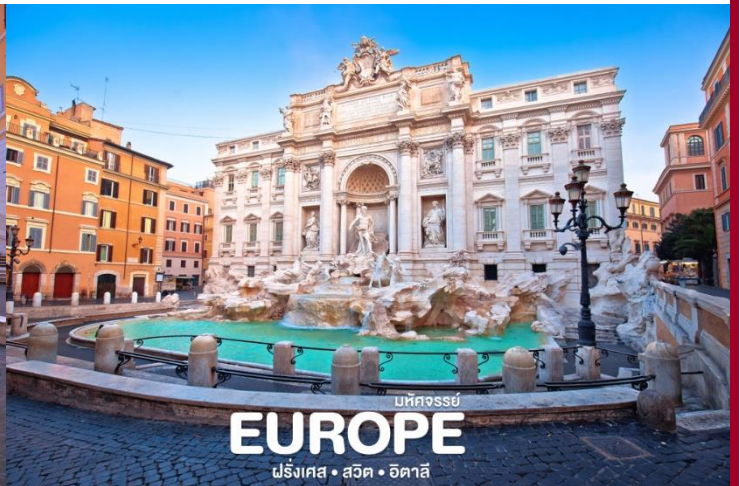
บัทจรรย์ EUROPE ฝรั่งเศส • สวิต • อิตาลี

เย็น อิสระอาหารเย็น เพื่อความสะดวกและไม่เป็นการรบกวนเวลาข้อป้บ่งของท่าน ได้เวลาอันสมควร นำท่านเดินทางสู่ ท่าอากาศยานเลโอนาร์โด ดา วินชี-ฟิอุมิชีโน (Aeroporto Leonardo da Vinci di Fiumicino) เพื่อให้ท่านได้มีเวลาทำการคืนภาษี (Tax Refund) 22.30 น. ออกเดินทางกลับสู่ กรุงเทพฯ ประเทศไทย โดยสายการบินกาทาร์แอร์เวย์ เที่ยวบินที่ QR114 ** บริการอาหารและเครื่องดื่มบนเครื่อง **