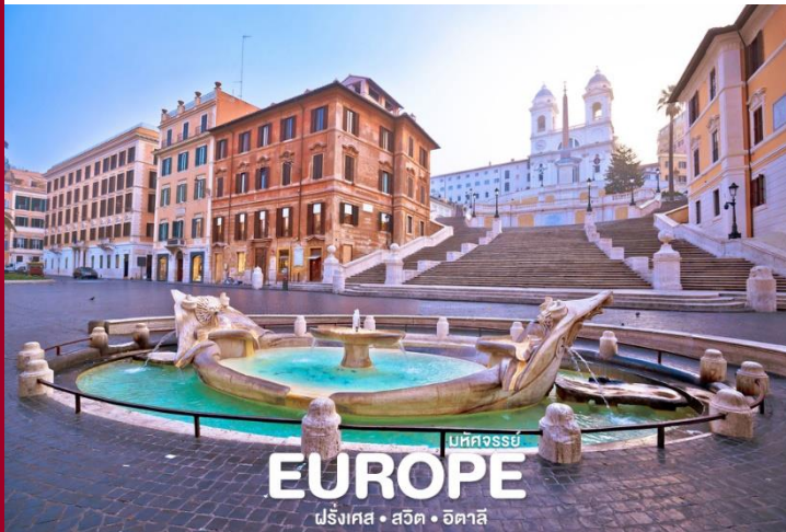
บัทจรรย์ EUROPE ฝรั่งเศส • สวิต • อิตาลี

นำท่านชมความงามของ น้ำพุเทรวี (TREVI FOUNTAIN) ที่มีกล่าวกันว่าเป็นน้ำพุที่สวยงามที่สุดแห่งหนึ่งใน โลก นำท่านเดินชมและถ่ายรูปบริเวณ บันไดสเปน (SPANISH STEPS) บันไดที่กว้างที่สุดในยุโรป เชื่อมระหว่างจัตุรัสสปิงนา กับโบสถ์ทรีนิตี นอกจากนี้ยังมีสินค้าแบรนด์เนมหลากหลายให้ท่านได้เลือกสรรค้อย่างเต็มที่ ไม่ว่าจะเป็น Gucci, Louis Vuitton, Prada, Longchamp, Chanel, DIOR, Balenciaga เป็นต้น แต่หากสนใจชิมกาแฟเอสเปรสโซ่ต้นตำหรับก็มีร้านกาแฟมากมายให้ท่านได้ลิ้มลอง