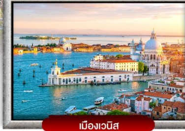
เมืองเวนิส

📍 ซอปปิง 4 เมือง ปารีส อินลาเก้น มิลาน โรม