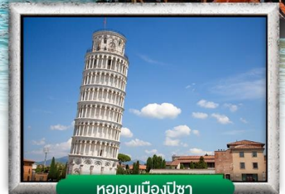
หอเอนเมืองปิซา

พิเศษ! สเปนาคัดดีเส้นหมึกดำ, พิซซ่าสไตล์อิตาลีเยี่ยมแท้