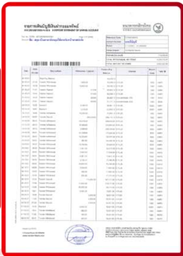
ตัวอย่าง Bank Statement ที่ผู้สมัครต้องขอธนาคาร

3.4 ปรับสมุดบัญชีธนาคารตัวจริง และเตรียมไปในวันที่ยื่นวีซ่า