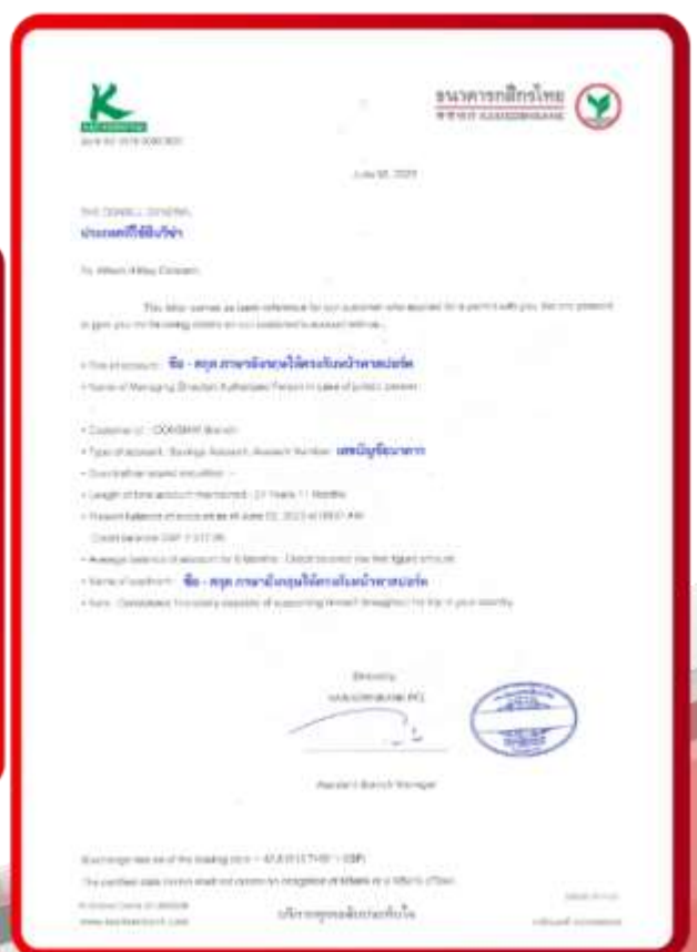
ตัวอย่าง Bank Guarantee ที่ผู้สมัครต้องขอธนาคาร