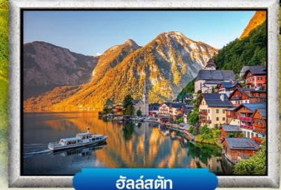
อัลส์สตีค