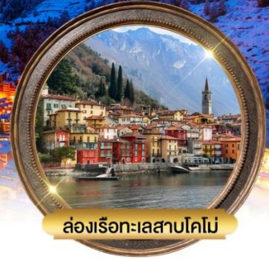
ล่องเรือทะเลสาบโคโม