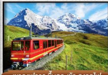
เขาจุงเฟรา ขึ้นกระเช้า ลงรถไฟ