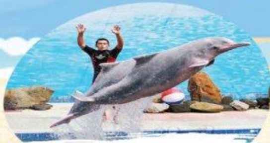
โอเอซิส ซีเวิลด์