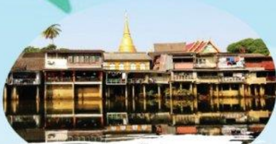
ชุมชนริมน้ำจันทบูร