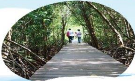
ศูนย์ศึกษารรรมชาติป่าชายเลนอ่าวคุ้งกระเบน