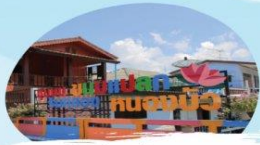
ชุมชนบ่อเกลือ ริมคลองหนองบัว