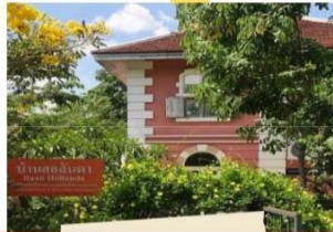
หมู่บ้านฮอลันดา