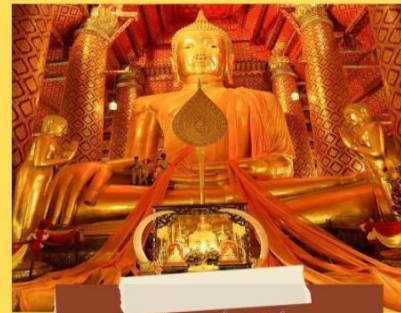
วัดพนัญเชิง