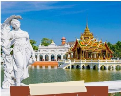
วัดนิเวศธรรมประวัติ