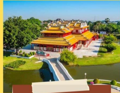
พระราชวังบางปะอิน