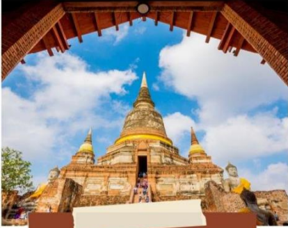
วัดใหญ่อริยมงคล