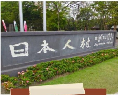
หมู่บ้านญี่ปุ่น