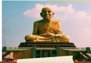
ตลาดหลวงปู่ทวดอยุธยา