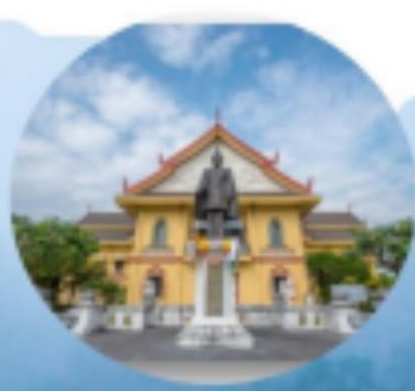
พิพิธภัณฑ์สถานแห่งชาติ น่าน