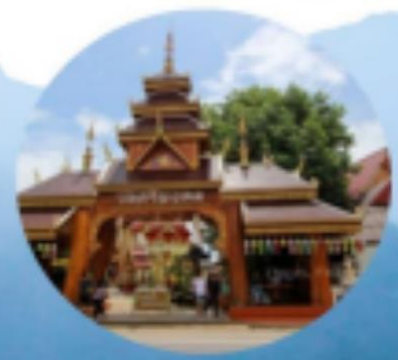
วัดศรีมงคล