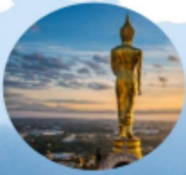
วัดพระธาตุเขาน้อย