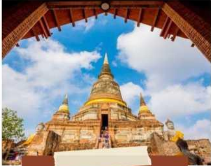
วัดใหญ่อริยมงคล