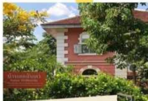
หมู่บ้านฮอลันดา