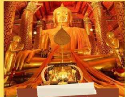
วัดพนัญเชิง