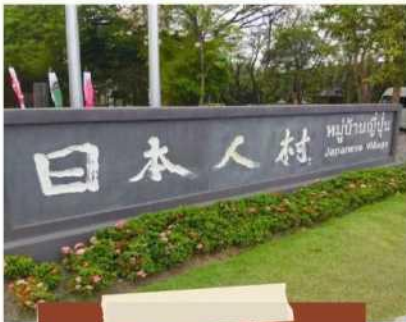
หมู่บ้านญี่ปุ่น