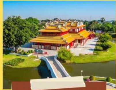
พระราชวังบางปะอิน