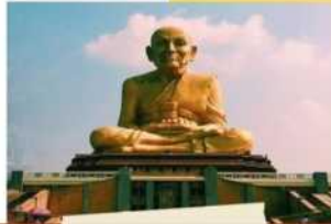
ตลาดหลวงปู่ทวดอยุธยา