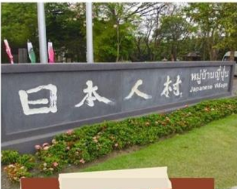
หมู่บ้านญี่ปุ่น