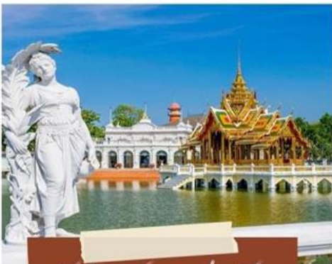
วัดนิเวศธรรมประวัติ