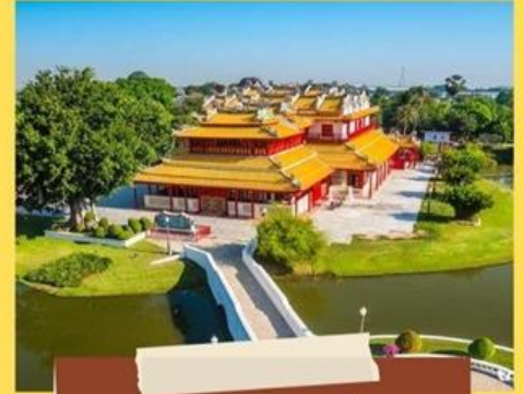
พระราชวังบางปะอิน