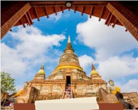
วัดพนมรัชมงคล