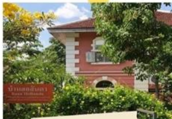
หมู่บ้านฮอลันดา