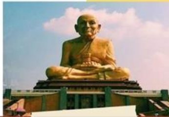
ตลาดหลวงปู่ทวดอยุธยา