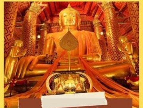
วัดพนมรุ้ง