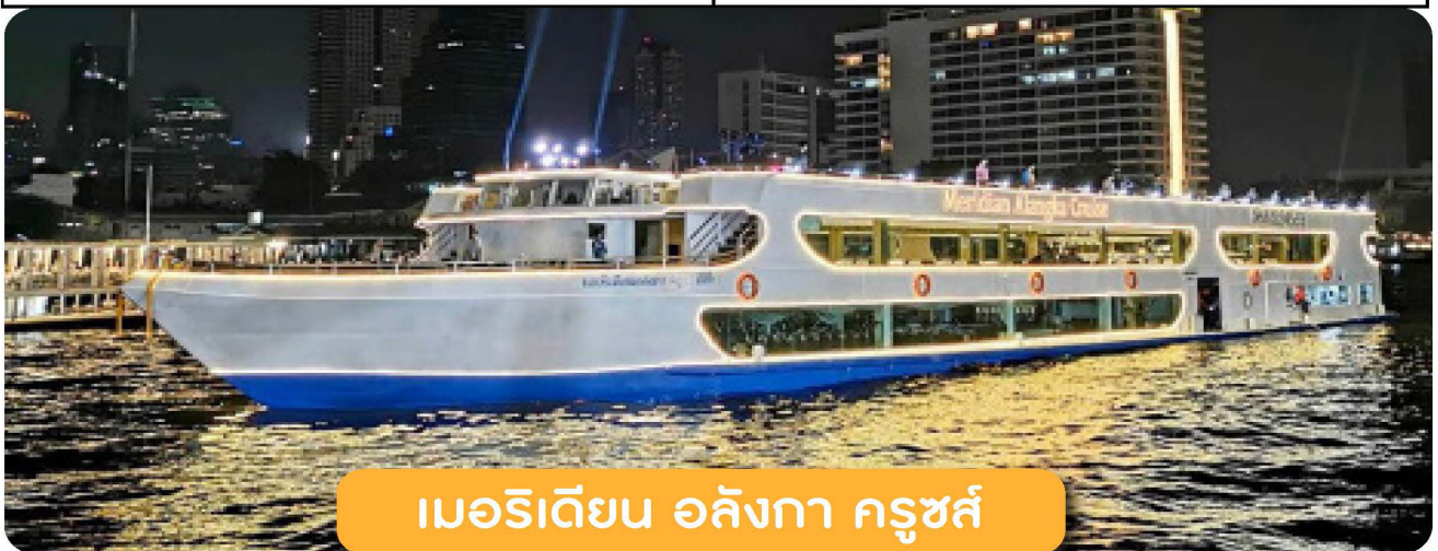
เมอริเดียน อลังกา ครุซส์