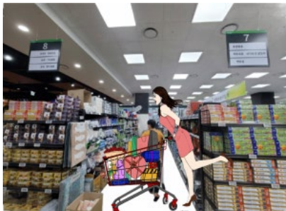
บรรจุกล่องตามเงื่อนไขของร้านด้วย

พาท่านเข้าชมและเลือกซื้อชุดเครื่องนอนเพื่อสุขภาพอันดับหนึ่งของประเทศเกาหลีใต้ Sesa Living ที่ใช้เส้นใยในการถักทอถึง 15400 เส้น กันไรฝุ่นได้100% มีการใช้หยกในการทำเส้นใย จึงมีคุณสมบัติในเรื่องของการบำบัดขณะนอนหลับ ซึ่งเนื้อผ้าจะมีสัมผัสที่นุ่มลื่น ไม่มีเสียงดังเมื่อขยับตัว และยังปรับอุณหภูมิที่คงที่ให้ร่างกายขณะนอนหลับพักผ่อนอีกด้วย และโชว์รูมแห่งนี้สามารถคืนภาษีให้กับนักท่องเที่ยวอีกด้วย