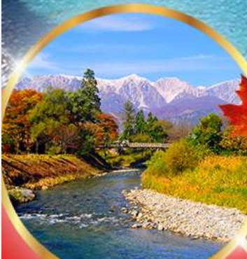
โออิตะ พาร์ค