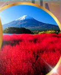
โออิชี พาร์ค

ราคา เริ่มต้น 39,919 บาท รวมภาษีมูลค่าเพิ่ม 7%