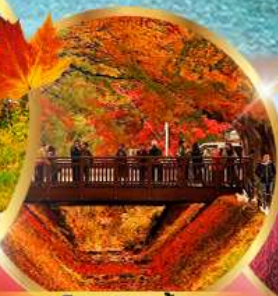
อุโมงค์เมบิล