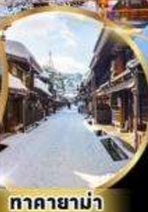
ทาคายามา