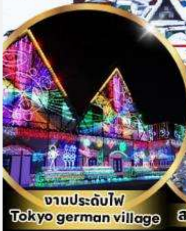
งานประดับไฟ Tokyo german village