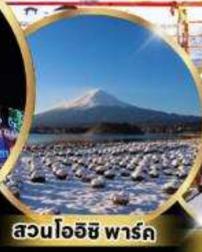
สวนโออิชิ พาร์ค