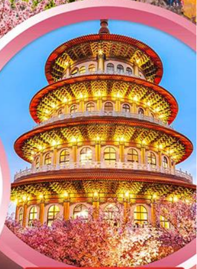
วัดจู้เทียนหยวน

ช้อปปิ้งจุใจ ย่านซีเหมินติง ตลาดไทจงไนท์มาร์เก็ต อิมมอร์อลกับ..เมนูปลาประดานาฮิดิ ซาซุบุฟเฟ่ต์สไตล์ไต้หวัน เสียวหลงเปา